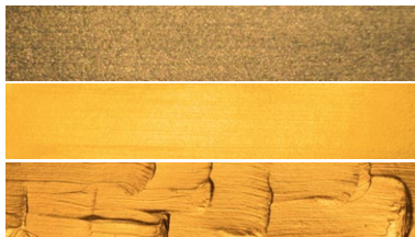
198 King's Gold PR101 PW6/PW15/PW20

Anwendungsbeispiele lasierend, deckend und pastos