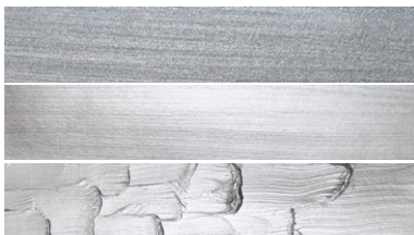
197 Brilliant Silver PBk7 PW6/PW15/PW20